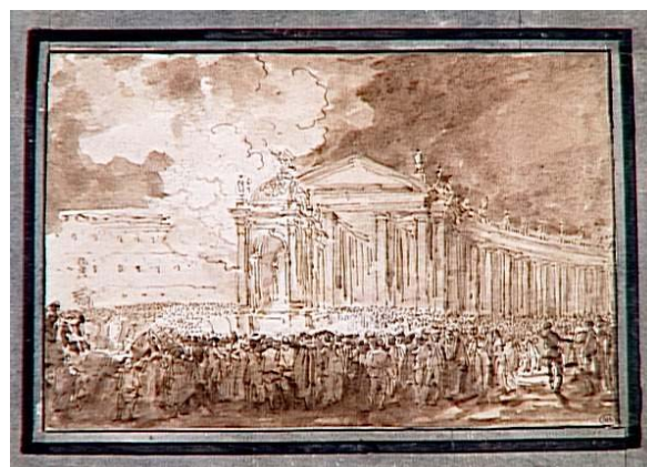
Hubert Robert à droite : Illuminations pour la fête du Corpus Christi, place Saint -Pierre à Rome.

Plume et encre brune, lavis brun, sur esquisse à la pierre noire.