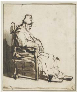
Rembrandt, à gauche : Vieil homme assis dans un fauteuil , Paris, musée du Louvre, département des Arts graphiques, coll. E. de Rothschild, inv. 195 DR © RMN/D.R. À droite : Jésus prêchant , Paris, musée du Louvre, département des Arts graphiques inv. RF 4717 © RMN/D.R.

Plusieurs études de femmes et d'enfants à l'encre, pleines d'attention et de douceur, nous évoquent la grande sensibilité de Rembrandt envers les jeunes enfants. On a pensé qu'il représentait sans doute des moments de sa vie domestique car Saskia donna naissance à quatre enfants entre 1635 et 1641. Mais seul le dernier, un fils nommé Titus, atteignit l'âge adulte. Rembrandt s'est inspiré, pour ces scènes, parfois prises sur le vif, des personnages de son entourage ou de la famille de l'oncle de Saskia. Une Etude pour une vieille femme assise , dont le visage a fortement marqué l'artiste au point qu'il a été reconnu comme celui de sa mère, voisine avec un portrait gravé de celle-ci, qui mourut en 1640 (musée du Louvre, coll. E. de Rothschild).