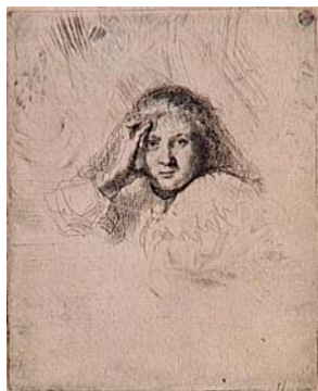
Rembrandt, à gauche : Portrait de Saskia (estampe). Paris, musée du Louvre, département des Arts graphiques, coll. E. de Rothschild, inv. 2513 LR À droite : Le Moulin à vent sur le bastion « Het Blauw hoofd » à Amsterdam . Paris, Institut Néerlandais, fondation Custodia, collection Frits Lugt, Inv. 5174

Les sentiments, attitudes ou liens suggérés dans les épisodes à deux ou trois personnages sont également très riches. Rembrandt par quelques traits de plume parvient à caractériser chacun des trois personnages dans Le Christ et les deux disciples sur la route d'Emmaüs ou La Parabole des talents (musée du Louvre). Le moindre mouvement est déterminant pour la cohésion des figures entre elles et montre combien l'artiste maîtrisait la construction d'une scène.