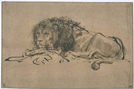
Rembrandt : Lion au repos , Paris, musée du Louvre, DAG, inv. RF 4721

Quatre institutions célèbrent Rembrandt à Paris