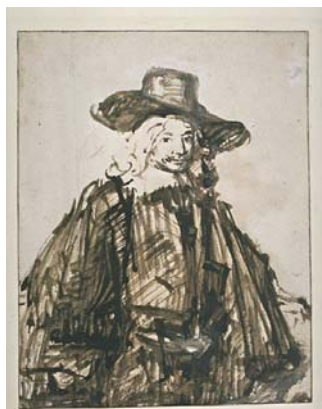
Rembrandt , à droite : Le Shah Jahân à cheval, un faucon sur le poing , inv. RF 4733 À gauche : Portrait d'homme , Inv. 22919 Les deux oeuvres : Paris, musée du Louvre, département des Arts graphiques