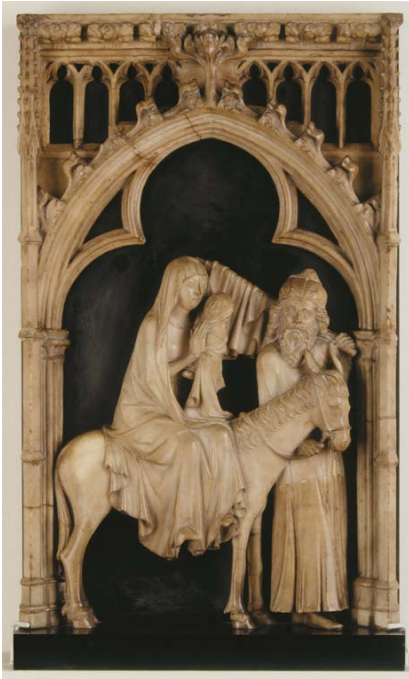
Élément d'un retable de l'Enfance du Christ : La Fuite en Egypte Ile-de-France, deuxième quart du XIV e siècle Marbre. H. 0,34 ; L. 0,286 m. Anvers, Musée Mayer Van den Bergh, inv. 2105