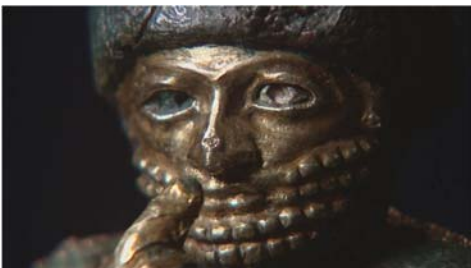
B... comme Babylone © Les Films du Tambour de Soie / ARTE / Musée du Louvre 2008

mercredi 15 avril 2009 à 20h à l'auditorium du Louvre