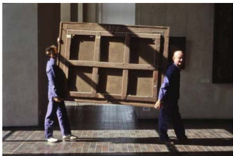
La Ville Louvre

À l'occasion des 20 ans de la pyramide, la chaîne Arte s'associe au musée du Louvre pour une programmation thématique spéciale « Grand Louvre - 20 ans de la pyramide ».