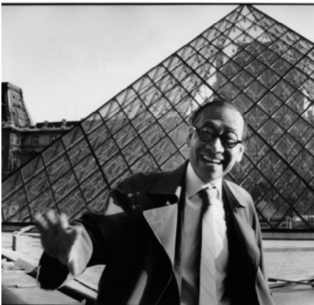
Ieoh Ming Pei devant la Pyramide du Louvre, 1989

En partenariat media avec France Culture