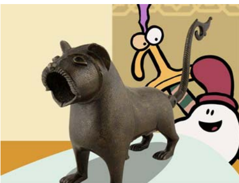
Une minute au musée