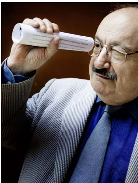
Umberto Eco