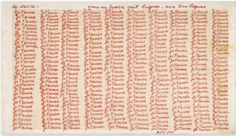
Louise Bourgeois JE T'AIME, 1977 Encre sur papier quadrillé 20.9 x 32.3 cm. Collection privée Photo: Zindman Fremont, © Louise Bourgeois