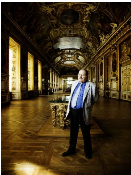
Umberto Eco, Galerie d'Apollon, musée du Louvre