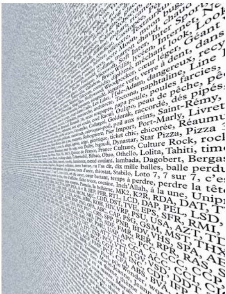
Claude Closky, Sans titre (marabout) , 1997, papier peint, impression sérigraphie. Vues d'exposition, "Voilà", Musée d'art moderne de la ville de Paris, 2000 Courtesy galerie Laurent Godin, Paris © Joséphine de Bère.