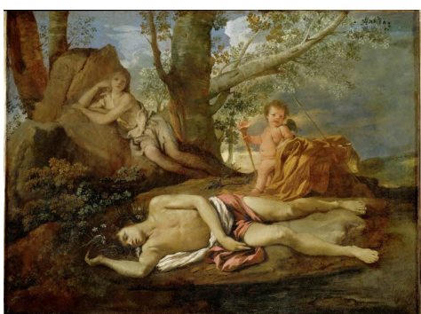
Écho et Narcisse , Nicolas Poussin vers 1630