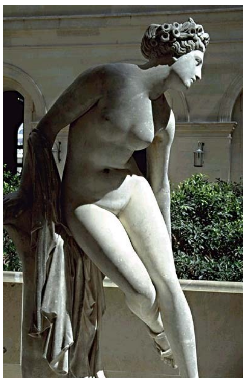
Eurydice mourante , Charles-François Leboeuf, dit Nanteuil 1822