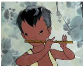
La Flûte et le Grelot

Deux films d'animation courts qui permettront aux plus petits de découvrir la peinture traditionnelle chinoise.