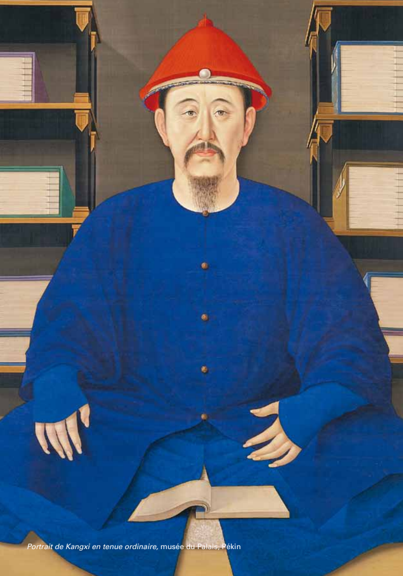
Portrait de Kangxi en tenue ordinaire, musée du Palais, Pékin