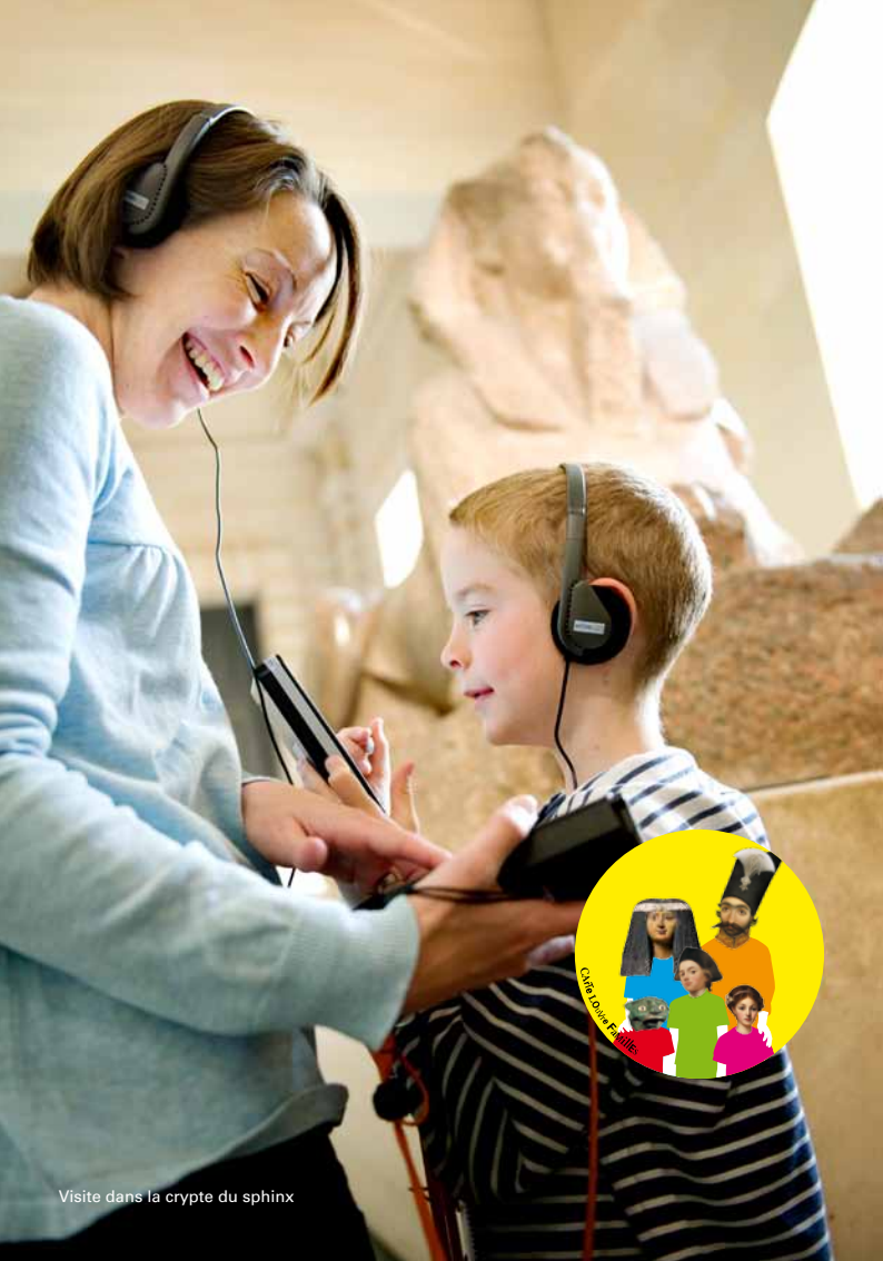
Visite dans la crypte du sphinx