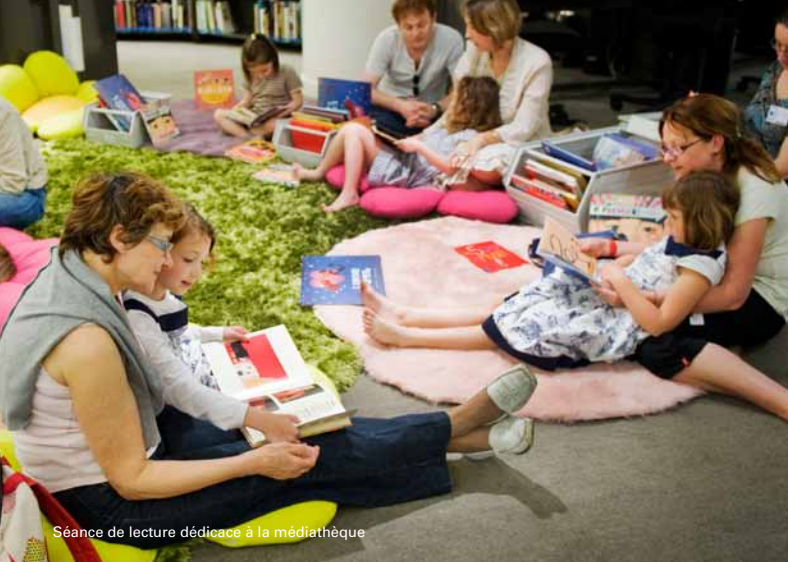
Séance de lecture dédiée à la médiathèque