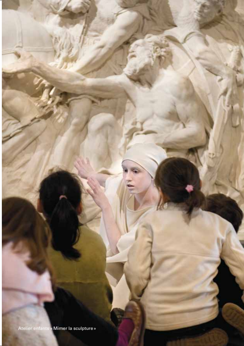
Atelier enfants « Mimer la sculpture »

À partir de 14 jours à l'avance jusqu'au jour de l'activité. – www.louvre.fr (début 2012) – Aux caisses de l'accueil des groupes de 9h à 17h 15. – 01 40 20 51 77 du lundi au vendredi de 9h à 16h (par CB uniquement).