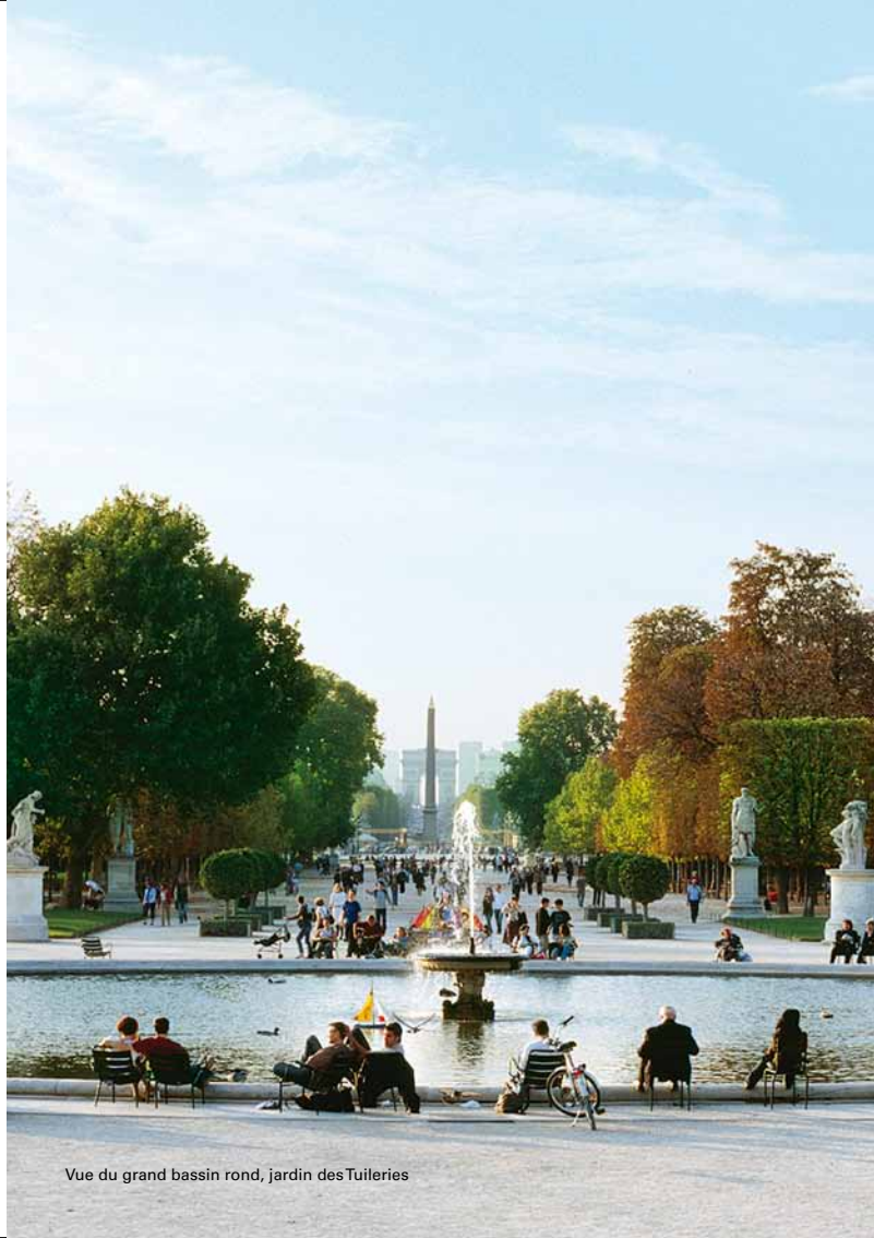
Vue du grand bassin rond, jardin des Tuileries

5€, 7€ (en période d'exposition temporaire). Le billet d'entrée au musée du Louvre donne accès le jour même au musée Eugène-Delacroix pendant les expositions temporaires.