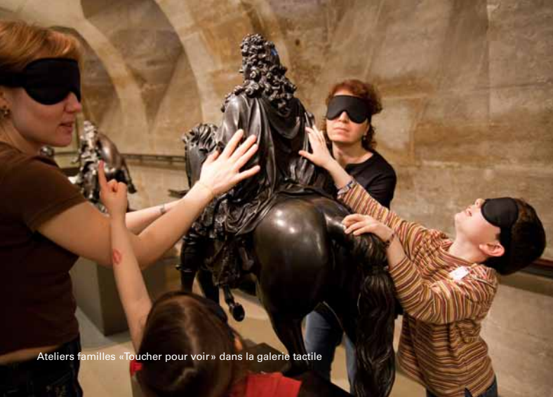
Ateliers familles «Toucher pour voir» dans la galerie tactile