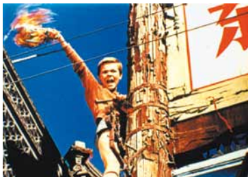
Le Cerf-volant du bout du monde de Roger Pigaud et Wang Kia-Yi

Vous n'écoutez plus jamais les Tableaux d'une exposition de la même oreille.