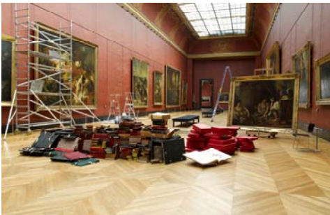
Jean-Philippe Toussaint Mardi au Louvre, état préparatoire © J.P. Toussaint, 2012

Je souhaiterais évoquer le livre sans passer par l'écrit. C'est, en quelques propositions plastiques, un hommage visuel au livre.