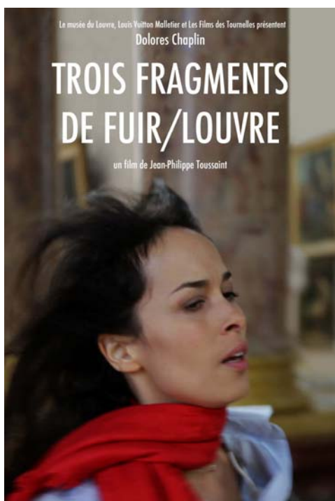
Jean-Philippe Toussaint Trois Fragments de Fuir 2012