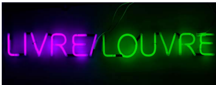
Jean-Philippe Toussaint, Néon Livre/Louvre

L'auteur engage une réflexion sur la lecture, le temps qui passe et la littérature. Il y est, entre autres, question de bibliothèque, de collection, et plus particulièrement de la collection Edmond de Rothschild du département des Arts graphiques. L'activité cérébrale est évoquée dans une installation qui associe des dessins de Le Brun à une cabine de douche expérimentale. Pour l'exposition, Jean-Philippe Toussaint a réalisé spécialement deux grandes compositions photographiques, Mardi au Louvre , qui évoque sous un jour inattendu la vie du musée le mardi, jour de fermeture, et un portrait de groupe d'écrivains contemporains librement inspiré de l'Hommage à Delacroix de Fantin-Latour. De même, mettant en rapport l'éternité de l'écrit et l'éphémère de la lecture, le manuscrit exceptionnel d' En attendant Godot de Beckett côtoie la huitième édition de La Divine Comédie de Dante, tous deux présentés en contrepoint de neuf tablettes électroniques ouvertes sur des traductions de La Divine Comédie de Dante en différentes langues.