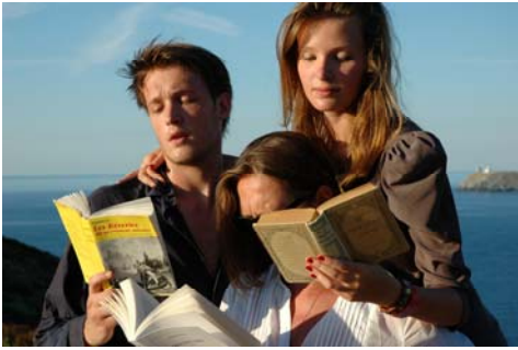
Jean-Philippe Toussaint, Aimer lire , Détail

Je souhaiterais évoquer le livre sans passer par l'écrit. C'est, en quelques propositions plastiques, un hommage visuel au livre.