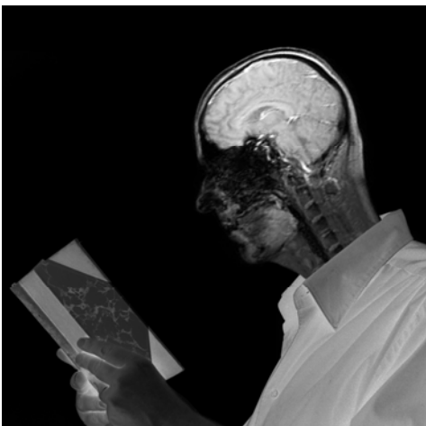
Jean-Philippe Toussaint Autoportrait en lecteur

Cette exposition bénéficie du mécénat en nature de Samsung Electronics France et de g.tec medical engineering