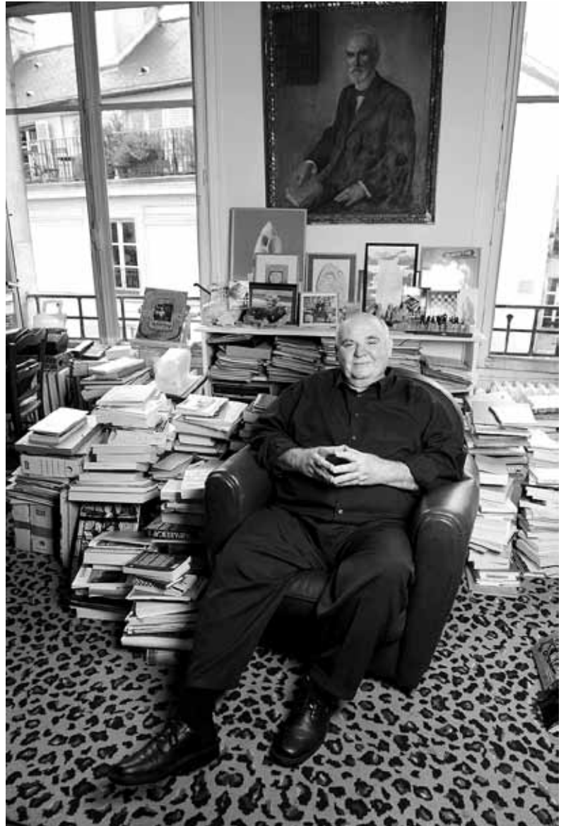
Michel Pastoureau

La « révolution bleue » des XII e et XIII e siècles