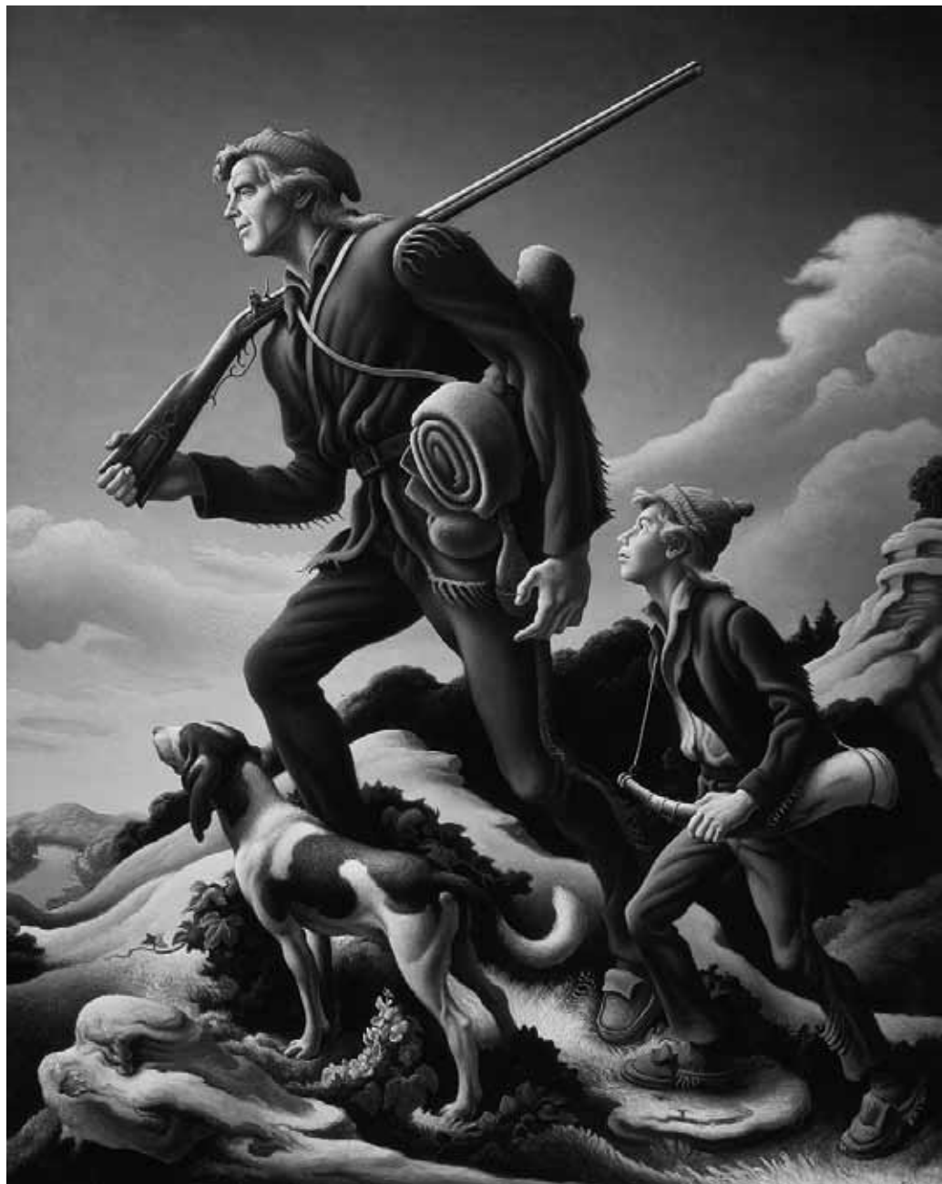
Thomas Hart Benton (1889-1975), The Kentuckian, 1954, LACMA