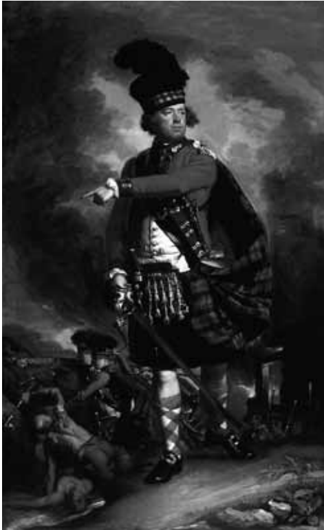
John Singleton Copley (1738-1815), Portrait de Hugh Montgomery, plus tard douzième comte d'Eglinton, 1780, LACMA