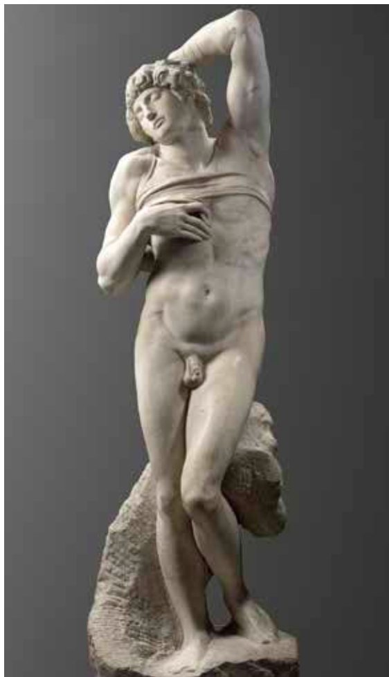
Michelangelo Buonarroti, dit Michel-Ange, L'esclave mourant, 1513-1516, musée du Louvre

« Le Corps et l'Âme » fait suite à l'exposition « Le Printemps de la Renaissance » présentée en 2013 au Louvre et au Palazzo Strozzi et consacrée aux prémices de l'art de la Renaissance à Florence dans la première moitié du Quattrocento.