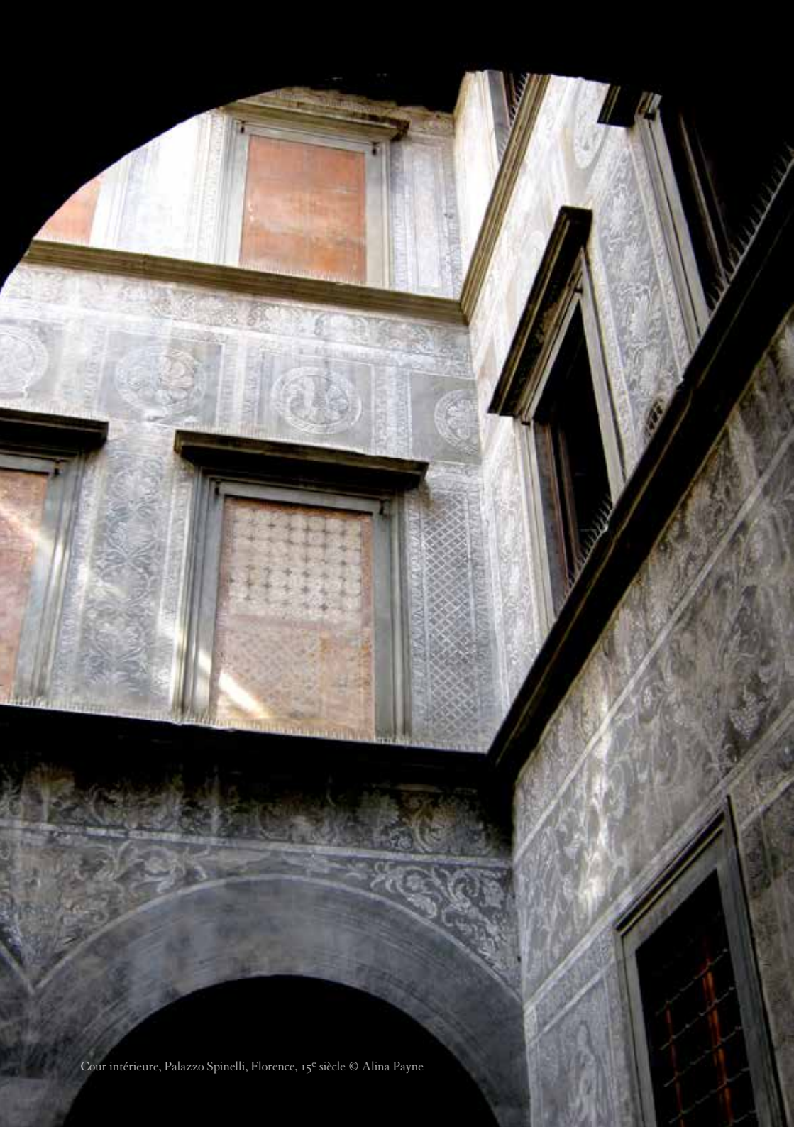
Cour intérieure, Palazzo Spinelli, Florence, 15 e siècle © Alina Payne