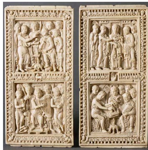
Psautier de Dagulf

Le manuscrit d'apparat contenant les portraits de la famille impériale de Manuel II de Constantinople (1391-1425) fut offert à l'abbaye de Saint-Denis en 1408 par l'empereur, de retour en Orient, en souvenir de la visite qu'il avait effectuée à l'abbaye lors de son voyage en Europe.