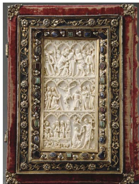
Manuscrit de Denys l'Aréopagite