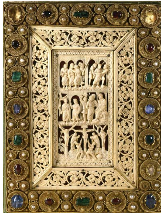
Évangiles de Drogon

Si l'exécution de ces manuscrits et de leurs enluminures est bien localisée dans l'espace et le temps, il n'en va pas toujours de même de leurs reliures, dont certaines présentent un aspect composite. Leur décor est formé à l'aide de matériaux aussi précieux que variés : or, argent, cuivre, ivoire, gemmes, perles... Ceux-ci, comme les techniques raffinées avec lesquelles ils étaient travaillés, avaient pour fonction d'accroître la valeur esthétique et spirituelle des livres.