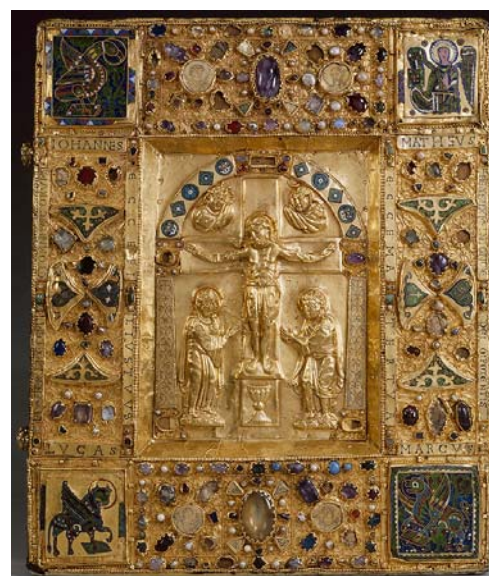
Boîte-reliure de Maastricht