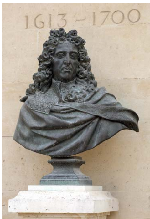
André Le Nôtre d'après Antoine Coysevox Dépôt du Fonds national d'art contemporain (Paris) Bronze

L'exposition promenade sur André Le Nôtre a été rendue possible grâce au généreux soutien de Champagne Laurent-Perrier .