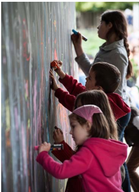
Activités en famille aux Tuileries, juin 2012

Le samedi 8 et le dimanche 9 juin 2013, le Louvre invite les familles à s'approprier l'art du prince des jardiniers. Des activités ludiques pour petits et grands, à réaliser en autonomie ou guidés par des médiateurs.