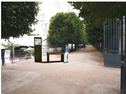
Simulation du parcours signalétique