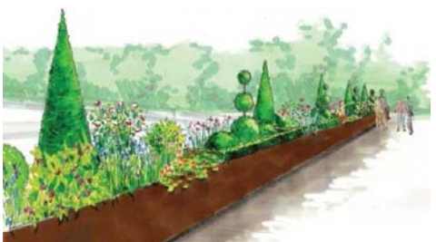
Simulation des plates-bandes installées dans le fer à cheval des Tuileries