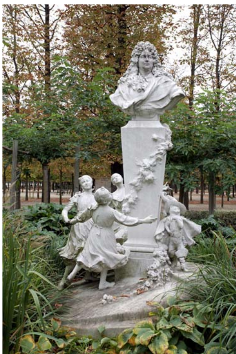
Gabriel Edouard Baptiste, Monument au conteur Perrault , Jardin des Tuileries