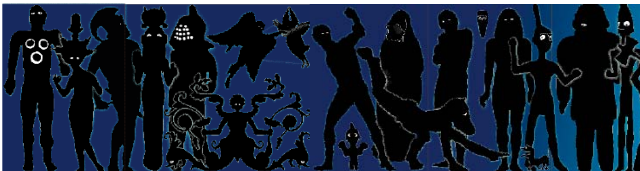
Frise des héros du Louvre, dans le couloir de sortie de l'exposition

- des dispositifs itinérants, pour aller au-devant de tous les publics (écoles, médiathèques, centre sociaux, entreprises, hôpitaux, ...).